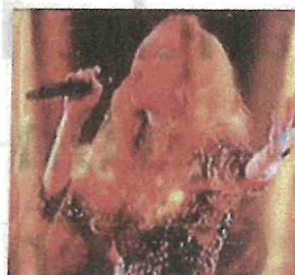
LILI - THE VOICE KIDS